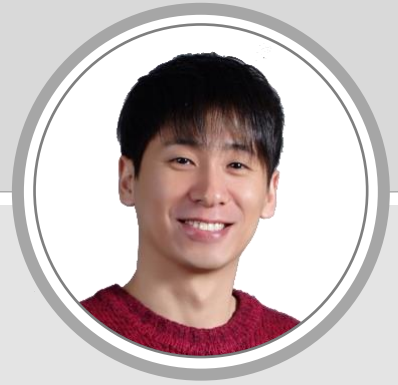
병역필(2004.02.-2006.02.) : 육군병장 만기제대